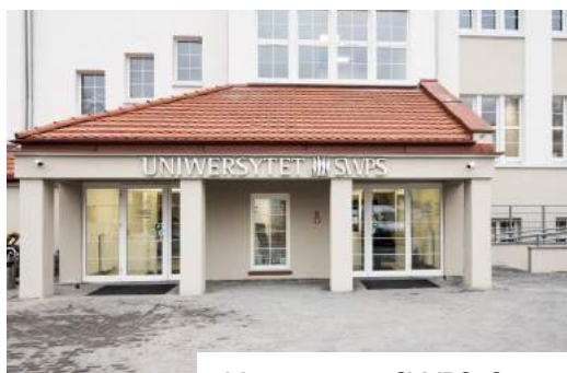
Uniwersytet SWPS, Sopot