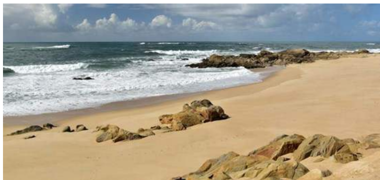
Na zachętę: plaża w pobliżu Vila do Conde :-)