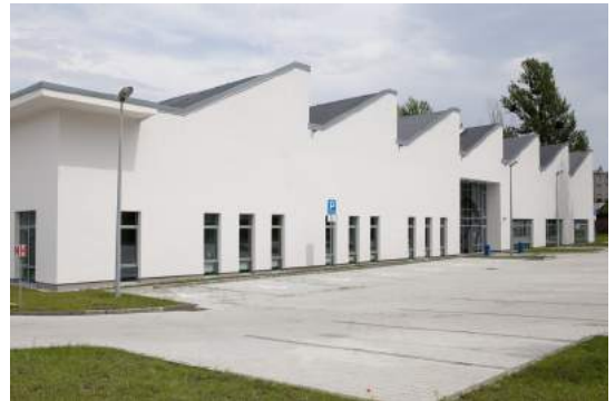
Uniwersytet SWPS, Wrocław

Dodatkowo, studenci mają możliwość przygotowywania prac magisterskich pod kierunkiem badaczy rozwoju człowieka . Wśród przykładowych prac magisterskich jakie zostały przygotowane w ostatnim czasie, wskazać można, między innymi: