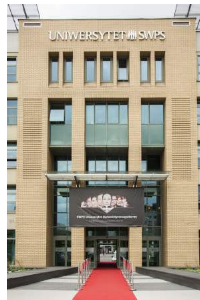
Uniwersytet SWPS, Warszawa

Na Wydziale Psychologii w Warszawie , psychologowie rozwoju pracują w ramach Katedry Psychologii Poznawczej, Rozwoju i Edukacji , gdzie zajmują się, między innymi, tematyką rozwoju poznawczego oraz jego pomiaru i diagnozy. Na Wydziale Psychologii w Sopocie funkcjonuje z kolei Zakład Psychologii Wspomagania Rozwoju , którego pracownicy interesują się psychologią kliniczną dziecka, psychologią szkolną i rozwojem poznawczym oraz zastosowaniami wiedzy o rozwoju człowieka. W pozostałych filiach Uniwersytetu, psychologowie rozwoju przynależą do katedr psychologii ogólnej (Poznań), poznawczej i różnic indywidualnych (Wrocław) oraz klinicznej i zdrowia (Katowice).