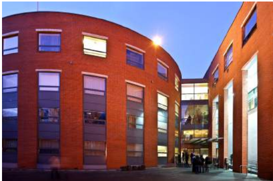
Uniwersytet SWPS, Poznań

Psychologia rozwoju człowieka jest na Uniwersytecie SWPS wykładana na pierwszym lub drugim roku studiów (w zależności od wydziału), mając na celu wprowadzenie studentów w problematykę najważniejszych zmian dokonujących się na przestrzeni całego życia oraz w zagadnienia związane z metodologią badań nad rozwojem człowieka. Nacisk kładziony jest na to, aby wiedza o rozwoju pozwoliła także lepiej zrozumieć zagadnienia z innych dziedzin podstawowych. Studenci zainteresowani dalszym rozwijaniem swojej wiedzy z zakresu psychologii rozwoju człowieka, angażują się w działania kół naukowych poświęconych tej subdyscyplinie, a począwszy od czwartego roku studiów, mają możliwość wybrania jednej z kilku specjalności, wśród których znajdują się takie, które oferują znaczne pogłębienie wiedzy o rozwoju człowieka. Na Wydziałach Psychologii w Katowicach i w Poznaniu realizowana jest specjalność Psychologia kliniczna dzieci i młodzieży , która obok aspektów klinicznych kładzie nacisk na ogólny rozwój w dzieciństwie i adolescencji, a na Wydziale Psychologii w Sopocie realizowana jest specjalność Psychologia wspomagania rozwoju , skoncentrowana na przygotowaniu studentów do pracy z dziećmi i młodzieżą, zarówno w obszarze zdrowia psychicznego, jak i wychowania i edukacji.