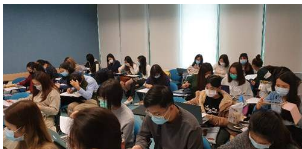
Ostatnie zajęcia przed przejściem uniwersytetu w tryb on-line

Czy koronawirus spowodował, że życie społeczne w Hong Kongu zamiera? Otóż ku mojemu zdziwieniu nie. Zbawiennym rozwiązaniem są, tak często krytykowane, nowe technologie. Życie akademickie na uniwersytecie toczy się w odmiennym i nie znanym mi dotąd trybie on-line. Zajęcia odbywają się w systemie ZOOM (podobnym do SKYPE). System daje naprawdę niezwykle możliwości. Można